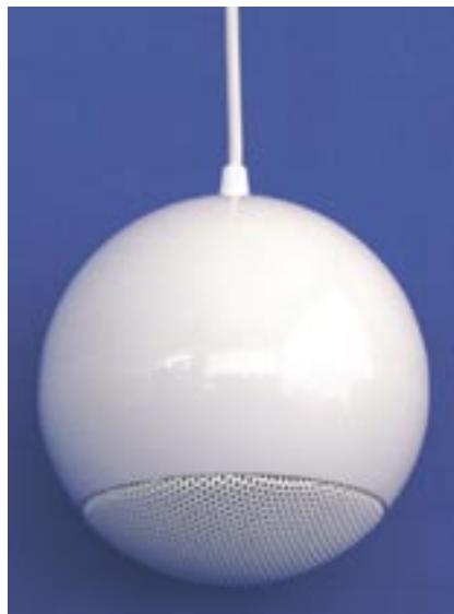
KL-180-CX10 / CX15

Der WDW-330-CX nutzt sein belüftetes Gehäuse als Bassreflex-System. Er überzeugt durch seine hervorragende Musikwiedergabe dank 2-Wege Technik. Die symmetrische Form ermöglicht eine horizontale und vertikale Montage. Schrauben und Dübel sind im Lieferumfang enthalten. Eine Diebstahlsicherung wird durch entsprechende Bauteile gewährleistet. Optional kann ein Lautstärkereger integriert werden.